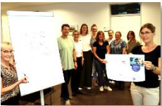
Der Arbeitskreis Medien