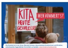
Postkarte der Kampagne

Den Bericht, eine Kurzbroschüre und weitere Informationen finden Sie auf bmfjsfj.de/kinder-und-jugendbericht .